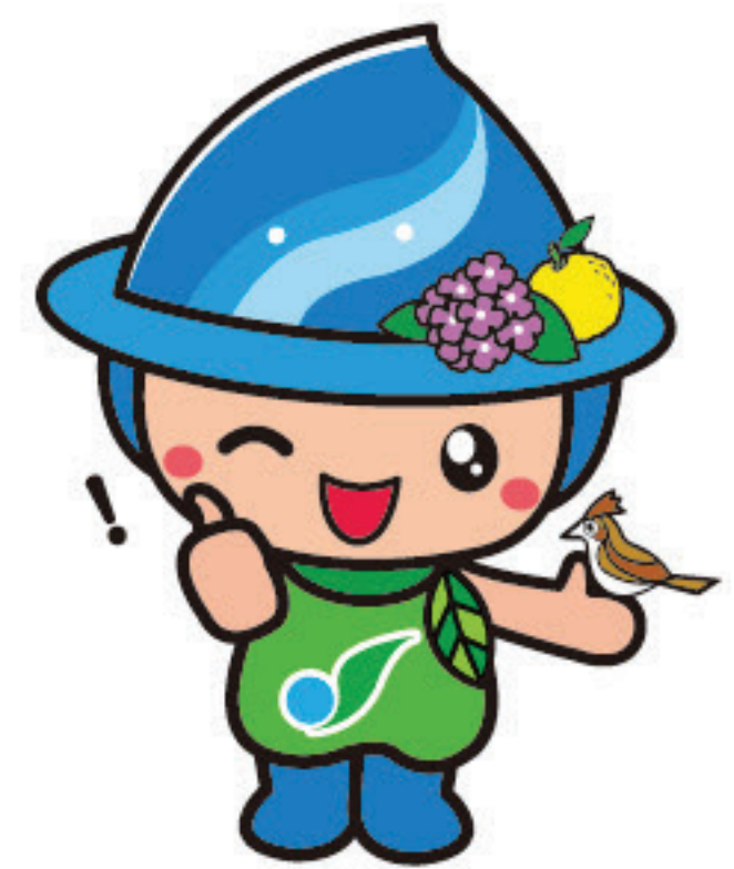
相模原市 マスコットキャラクター さがみん

おトくに、カンタンに、自然の電気を利用してみませんか? 電気は 選べる時代です。電力契約を切り替えるだけで、環境にやさしい自 然の電気をご利用いただけます。2050年脱炭素社会の実現に 向けて、この機会にぜひご検討ください!